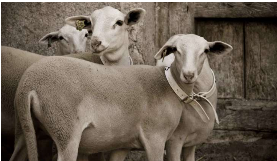
*Ovejas de Raza Segureña