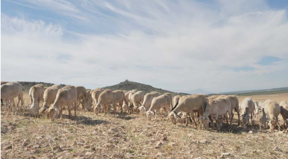
*Rebaño segureño pastando en el campo.