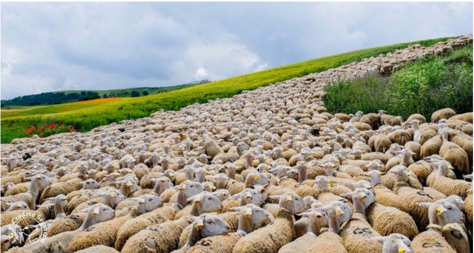
*Rebaño de ovejas segureñas.

Estos registros contendrán los datos establecidos en el ANEXO II necesarios para rastrear cualquier partida de corderos amparados por la IGP.