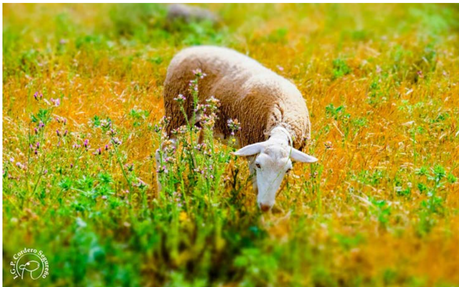
*Cordero segureño pastando en el campo.